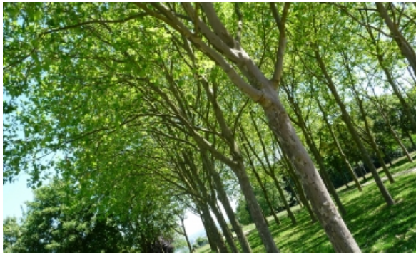
Jardin du Belvédère