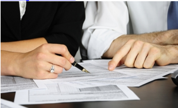
Point Conseil Emploi 36 mail Mendès France Tél. 01 34 24 53 54