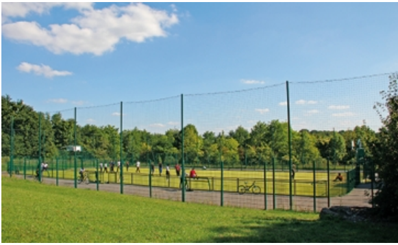
Terrain Multisports Chemin de la Pierre Levée