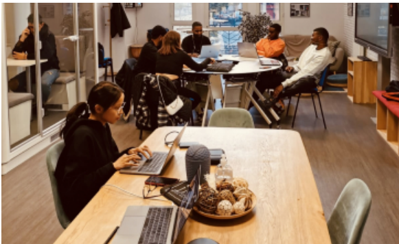
Esquisse Coworking Place des Amoureux Tél. 01 34 24 53 41 / 01 34 24 71 59