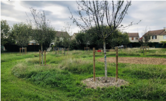
Le verger d'Hélène