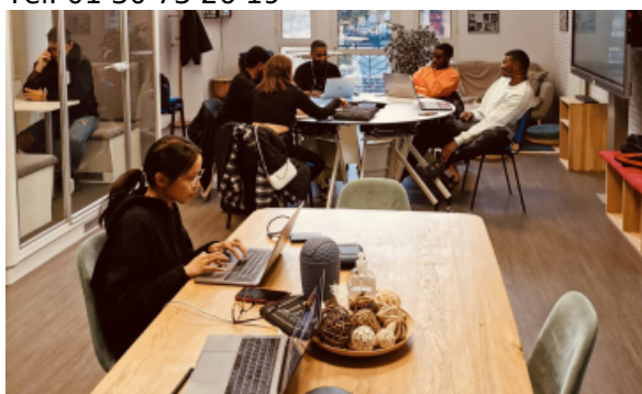
Esquisse Coworking Place des Amoureux Tél. 01 34 24 53 41 / 01 34 24 71 59