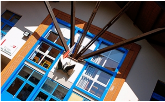
Collège Les Toupets 46 avenue Louise Michel Tél. 01 30 73 20 22