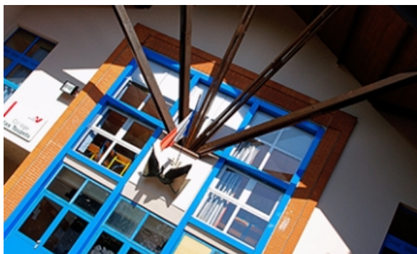
Collège Les Toupets 46 avenue Louise Michel Tél. 01 30 73 20 22