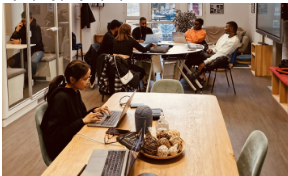
Esquisse Coworking Place des Amoureux Tél. 01 34 24 53 41 / 01 34 24 71 59