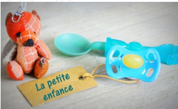
Relais Petite Enfance 4 avenue Gandhi Tél. 01 34 24 53 79