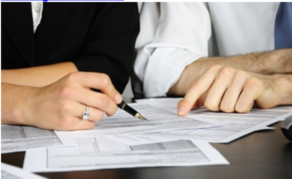
Point Conseil Emploi