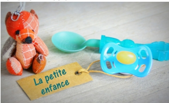
Relais Petite Enfance 4 avenue Gandhi Tél. 01 34 24 53 79