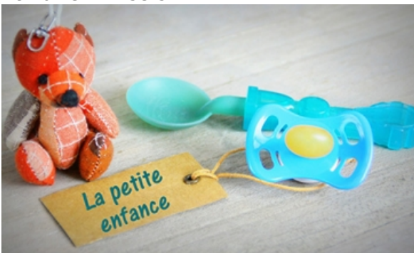
Relais Petite Enfance