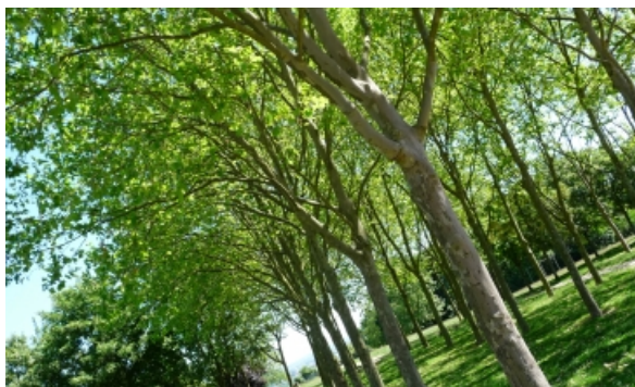
Jardin du Belvédère