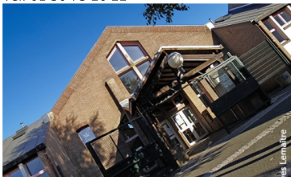
École des Hauts-Toupets 4-6 chemin des Hauts Toupets Tél. 01 30 73 26 19