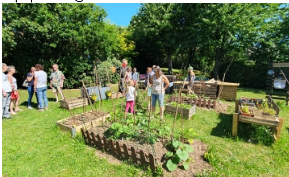
Le JP des Collines

26 mail Mendès France Tél. 01 34 22 18 36 equipeludo@mairie-vaureal.fr