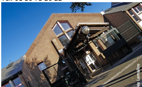
École des Hauts-Toupets 4-6 chemin des Hauts Toupets Tél. 01 30 73 26 19