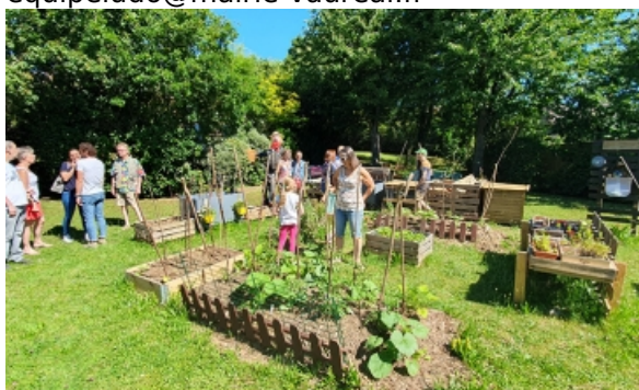
Le JP des Collines

26 mail Mendès France Tél. 01 34 22 18 36 equipeludo@mairie-vaureal.fr