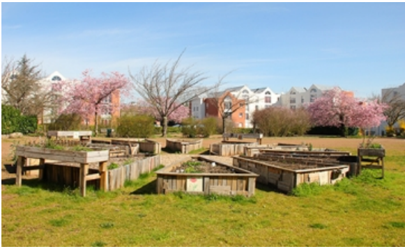
Le Mandala des Hauts-Toupets Square de la Marnière